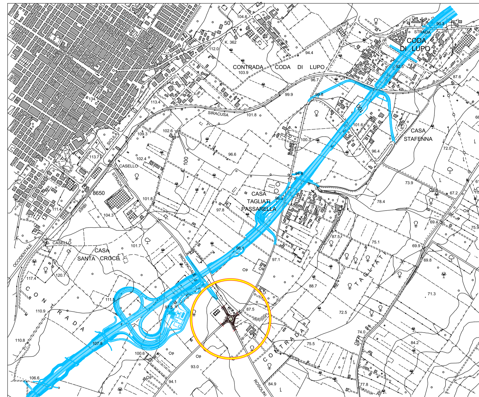
STRALCIO DELLA CARTOGRAFIA SCALA 1: 10.000