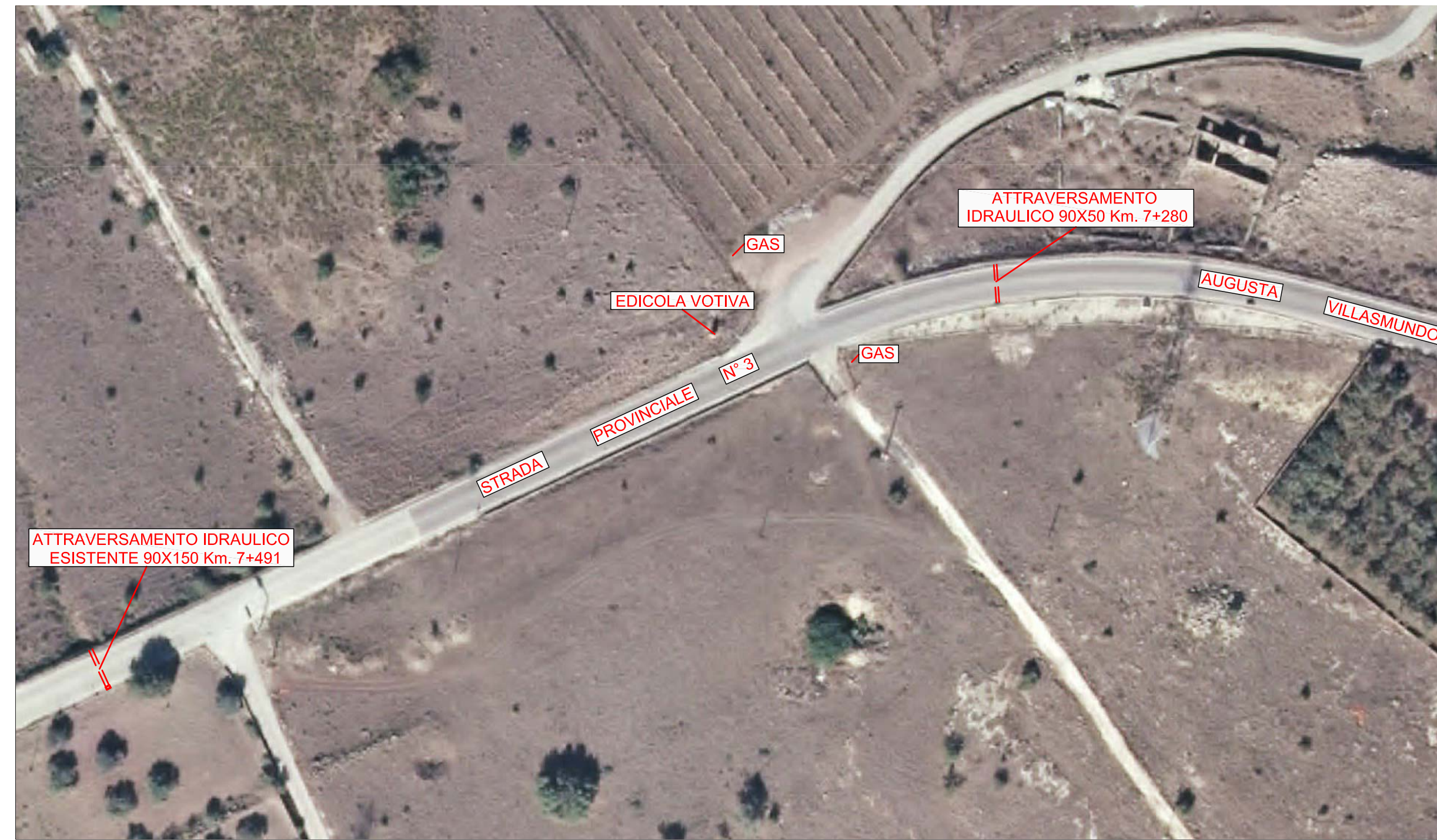
S.I.T.R. REGIONE SICILIA 1:1.000