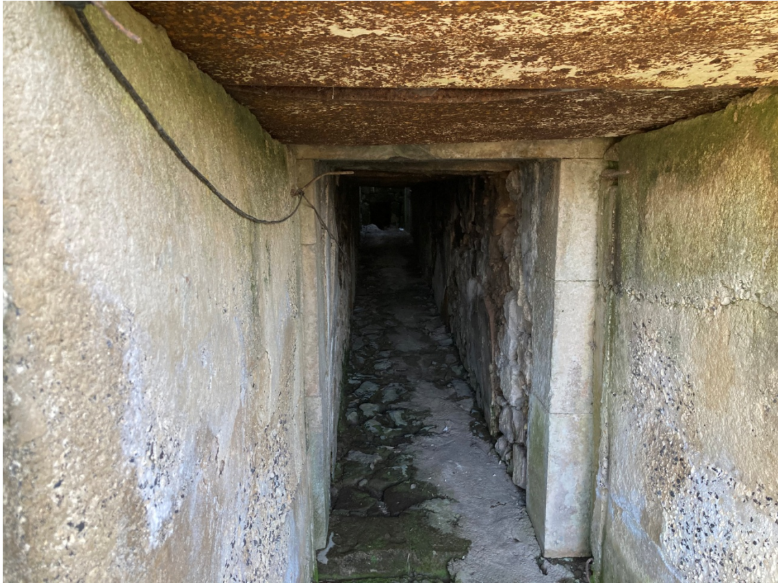
8 - Sbocco tombino di attraversamento idraulico