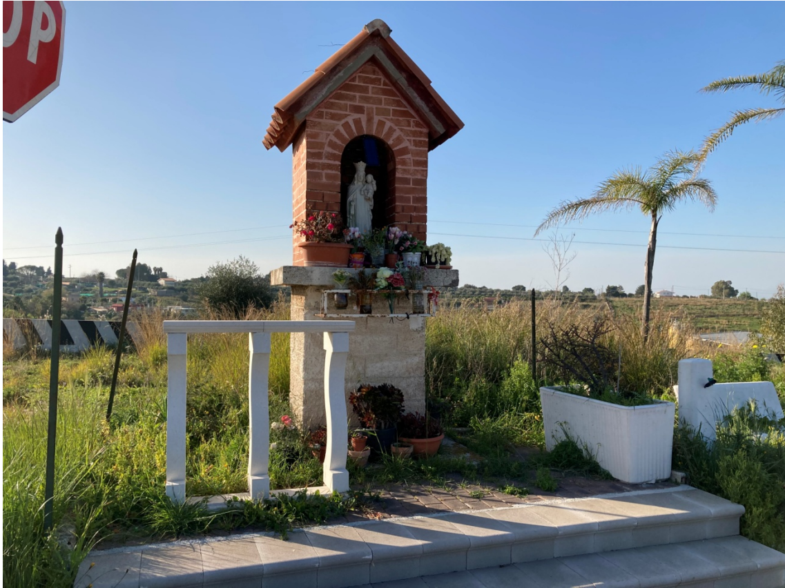
2 - Edicola votiva da riposizionare