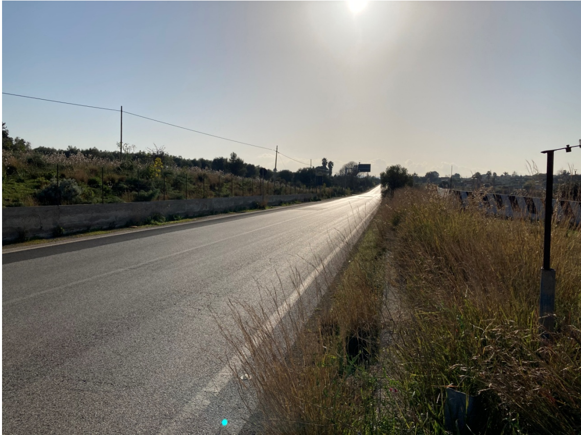
Figura 4 - Vista intersezione lato Villasmundo