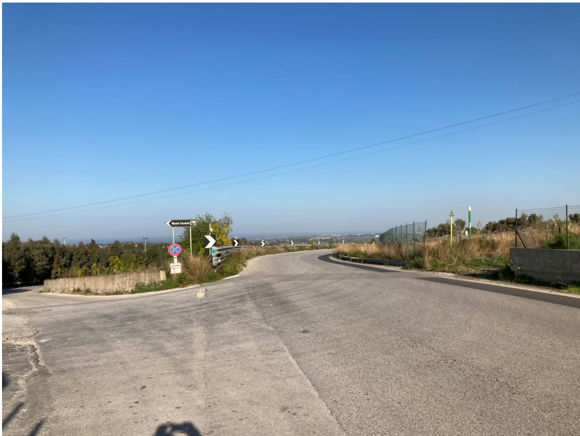
3 - Vista intersezione lato Augusta