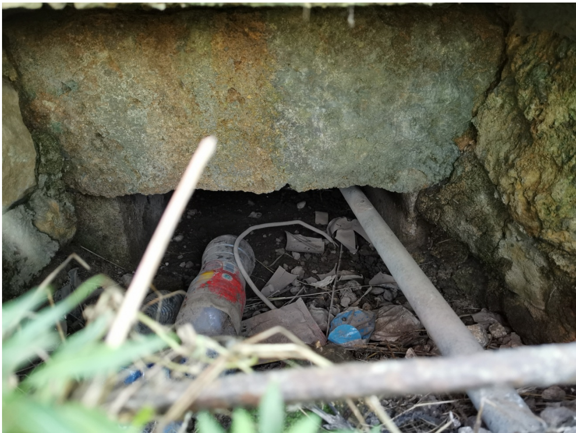
8 - Sbocco tombino di attraversamento idraulico