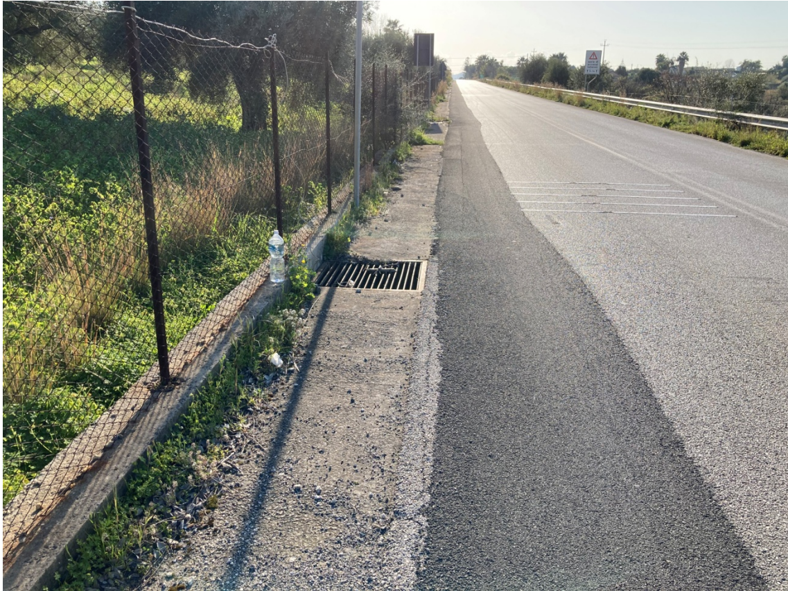
6 - Griglia di captazione acque lato Villasmundo e attraversamento idraulico