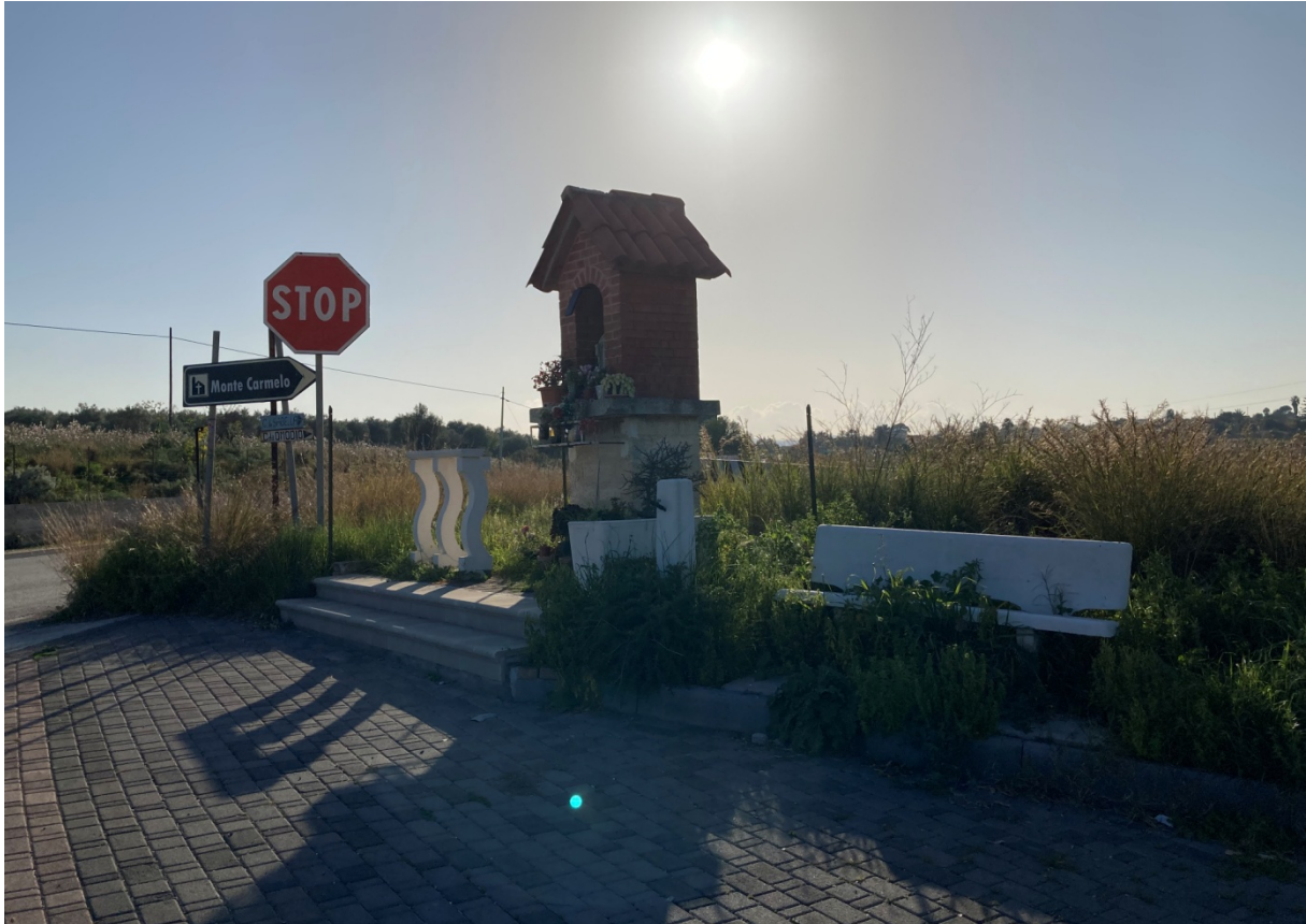
2 - Edicola votiva da riposizionare