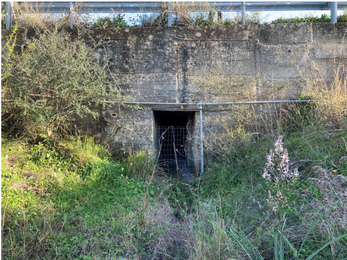
7 - Sbocco tombino di attraversamento idraulico