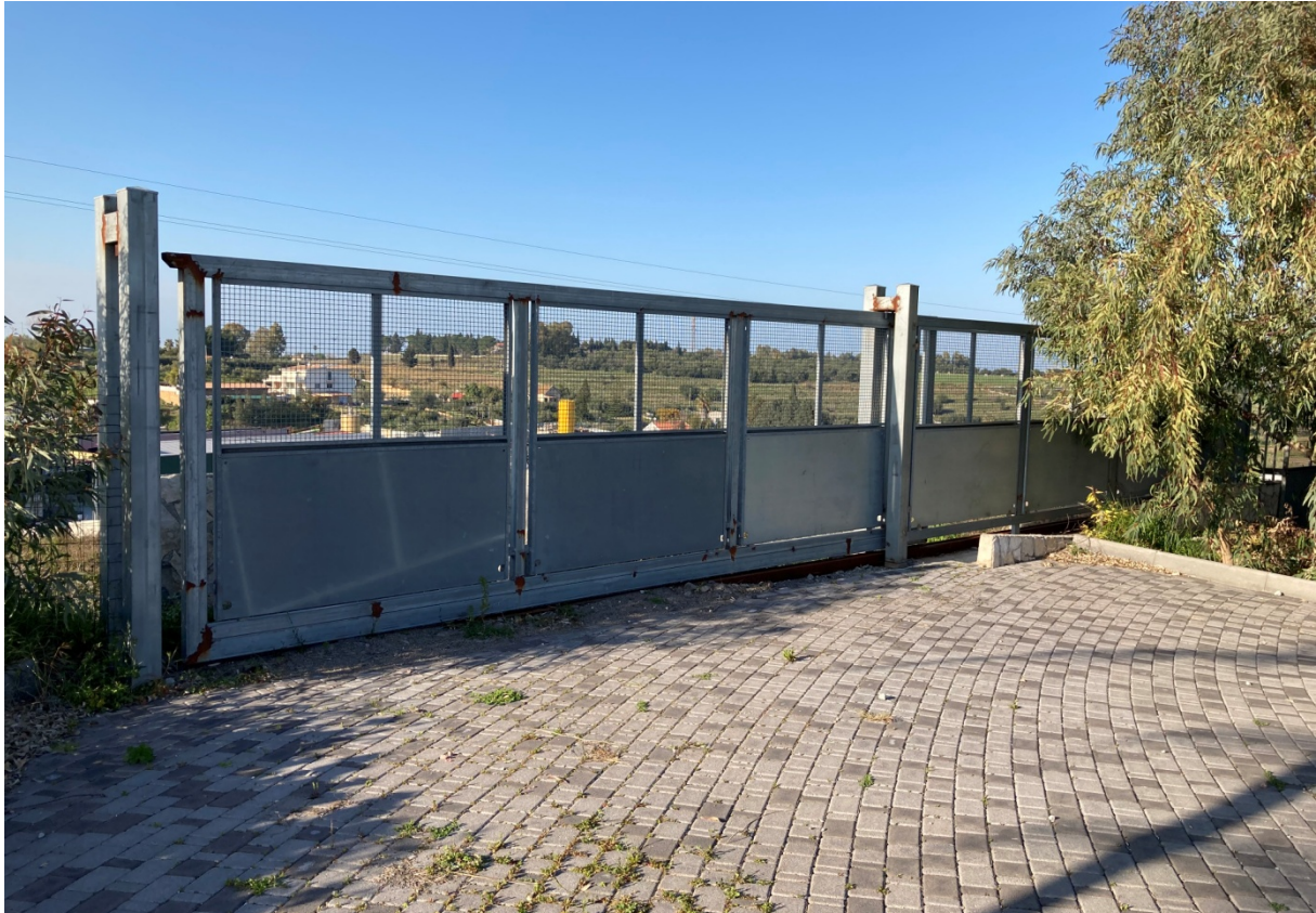
1 - Cannello metallico da riposizionare