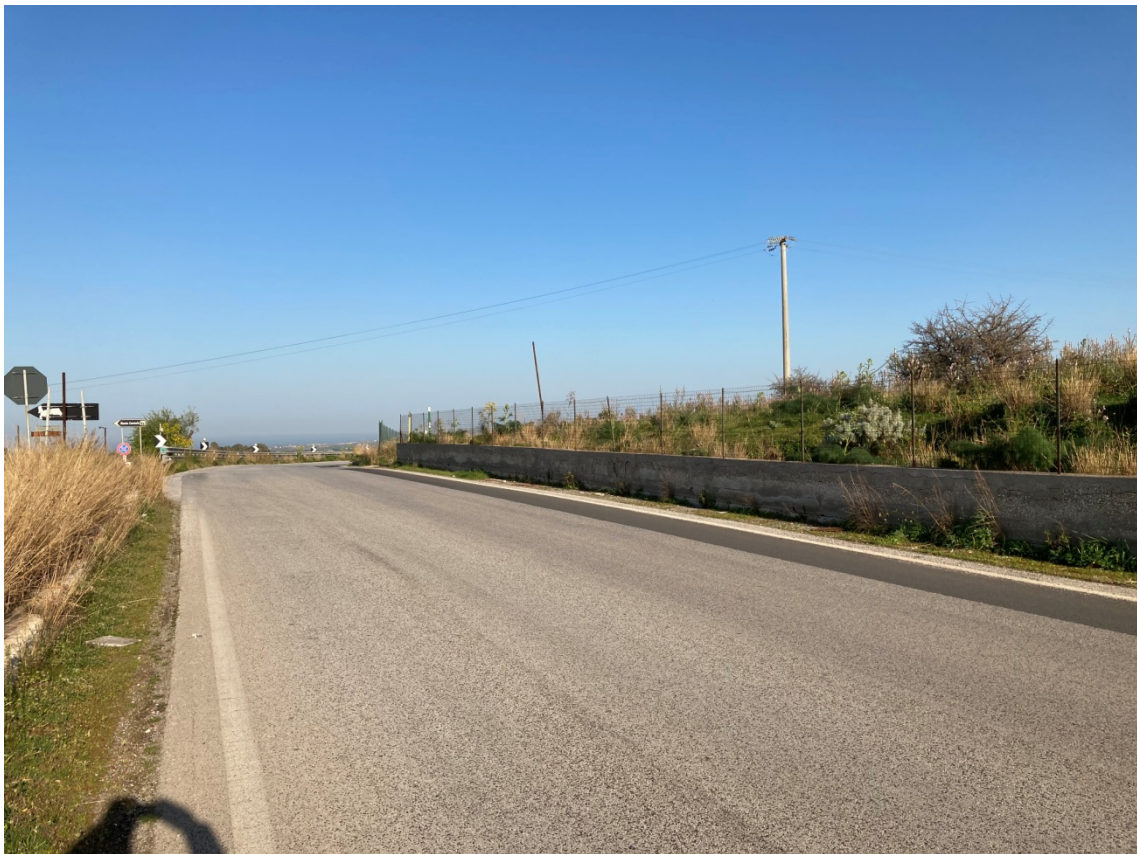
5 - Muretto di delimitazione aree private a sud della S.P. n.3