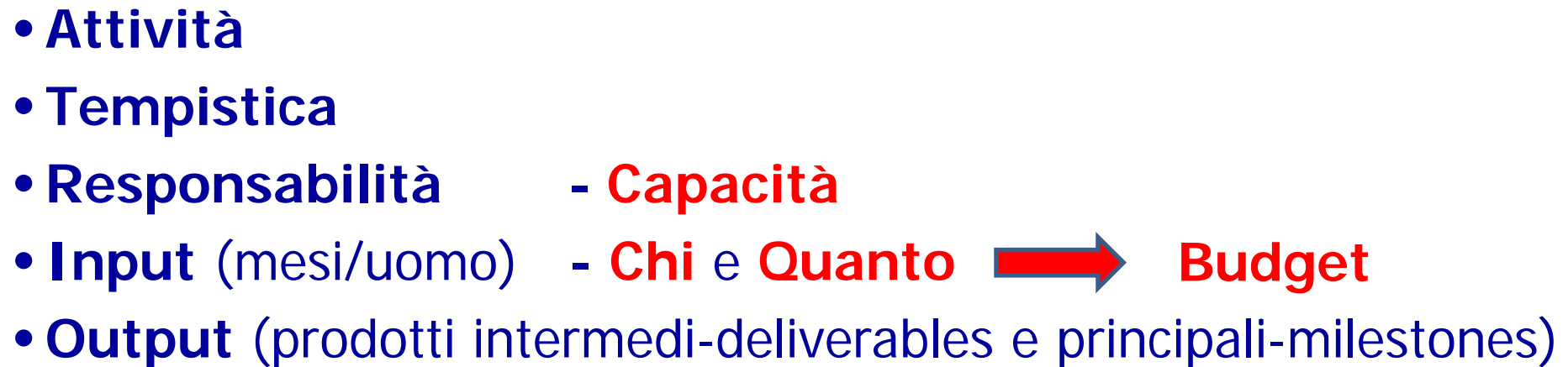
Tabella Attività - Pacchetti di lavoro