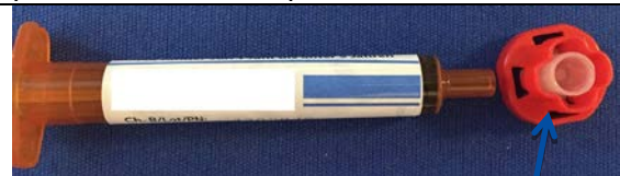
Figura 1. CORRETTA rimozione del cappuccio protettivo semitrasparente