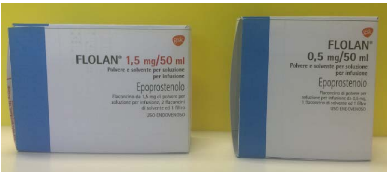
Confezioni Flolan solvente (pH 10,5)