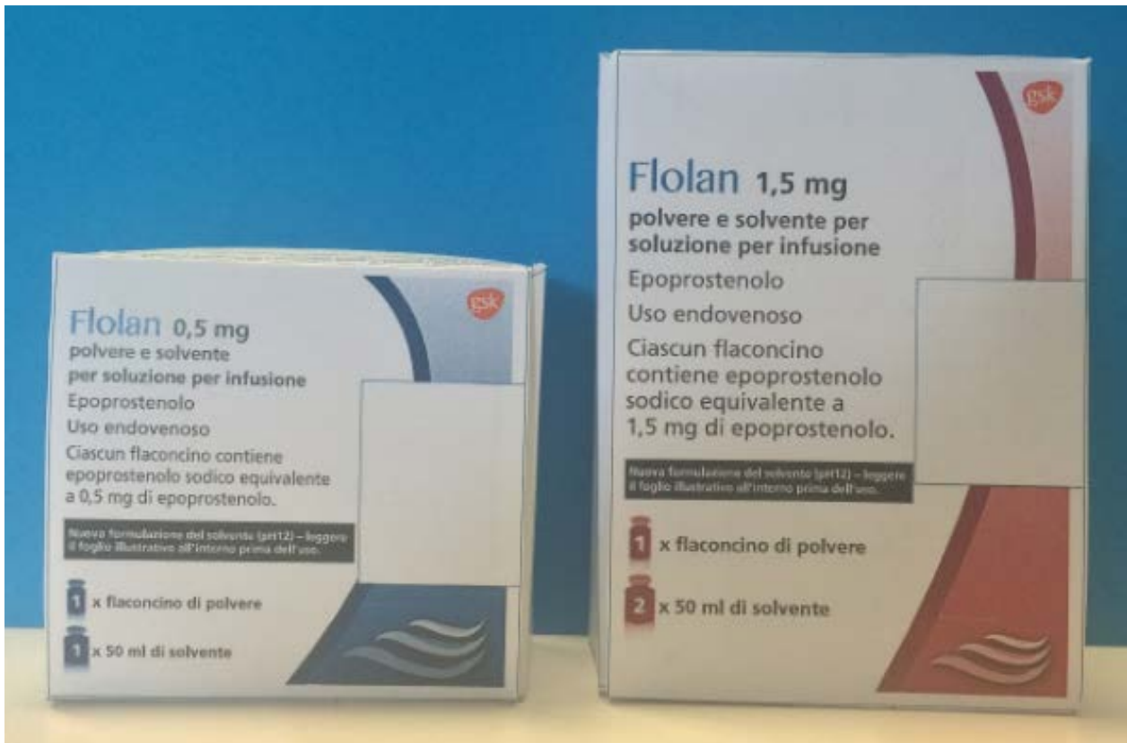
Confezioni Flolan NUOVO solvente (pH12)