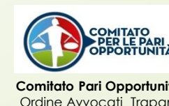
Comitato Pari Opportunità Ordine Avvocati Trapani