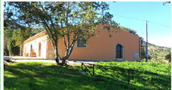
L'area di accoglienza e didattica