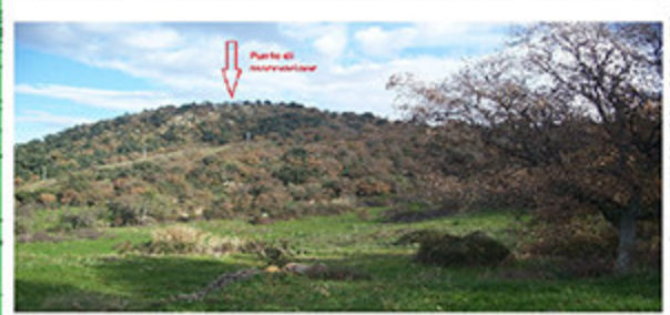
Uno dei punti di osservazione