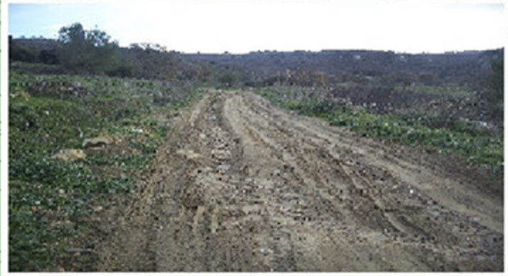
La viabilità principale