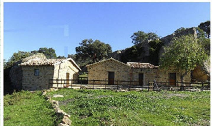
I fabbricati - area sosta -