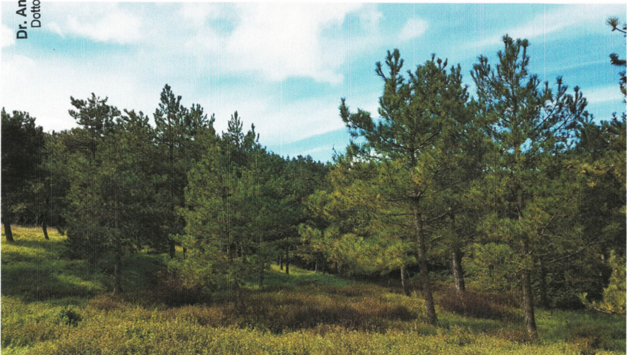
Figura 2 - Stato delle pinete presenti all'interno del "Parco Fiera"