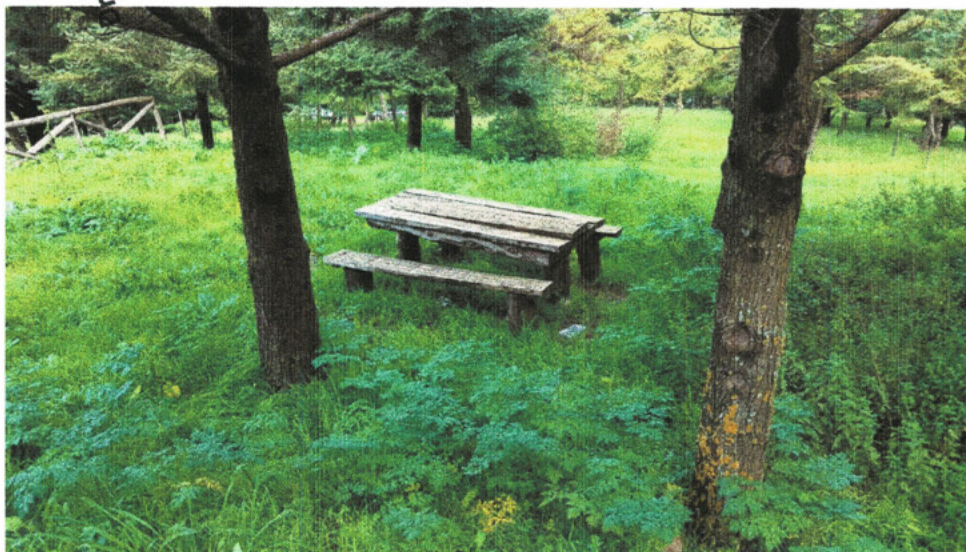
Figura 8 - Area Pic - Nic da ripristinare e/o recuperare