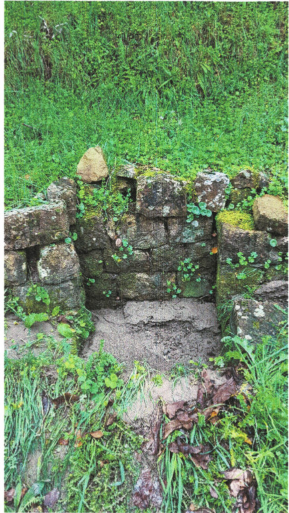
Figura 7 - Canali di scolo delle acque meteoriche (sx) e punti di approvvigionamento di acqua (dx) da ripristinare e/o recuperare