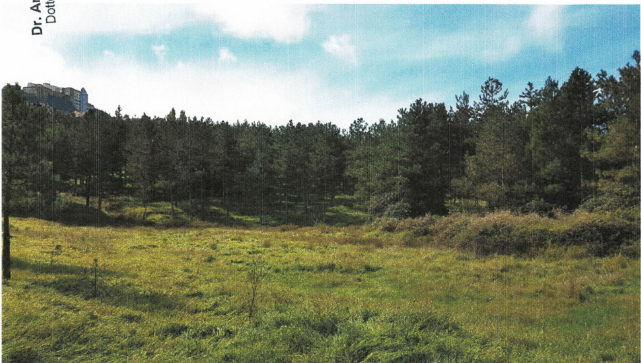
Figura 4 - Stato della pineta presente all'interno del "Parco Fiera"