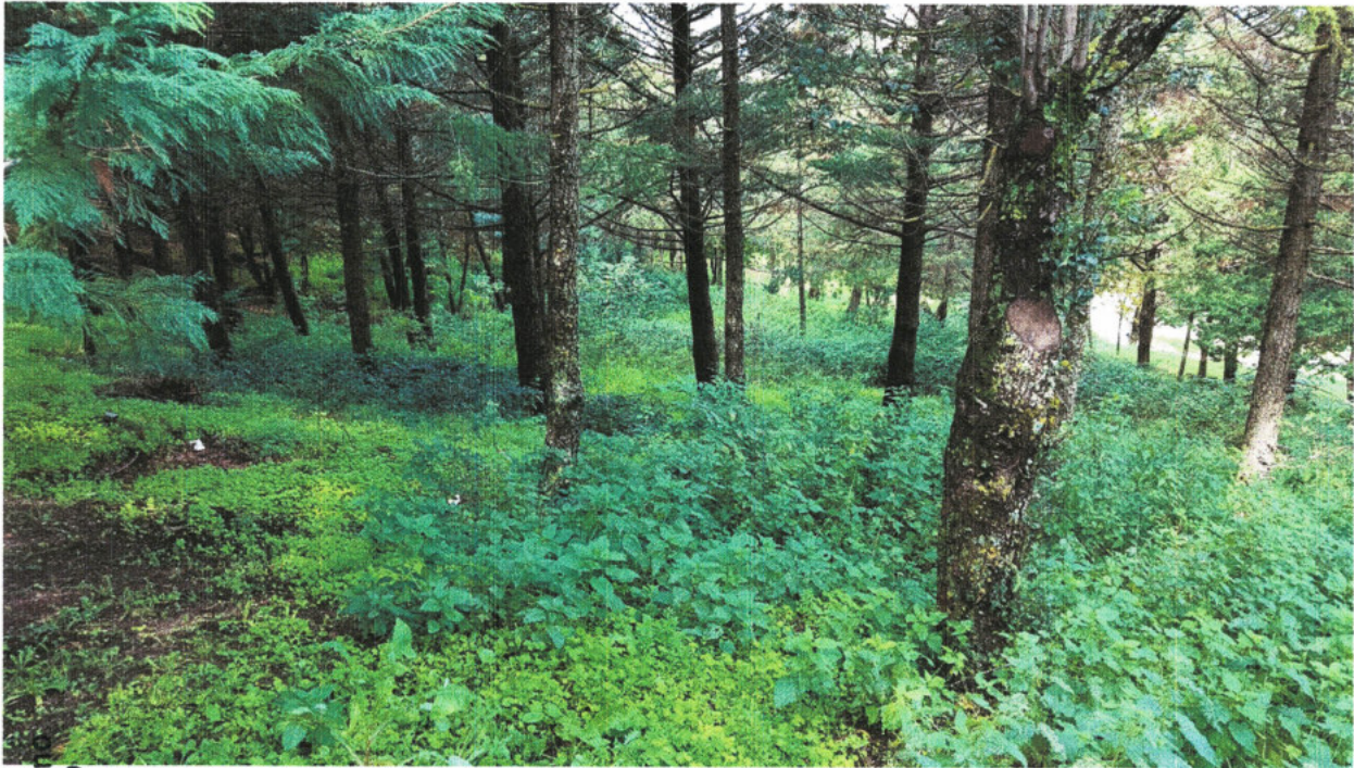
Figura 1 - Stato della vegetazione forestale presente all'interno del "Parco Fiera"