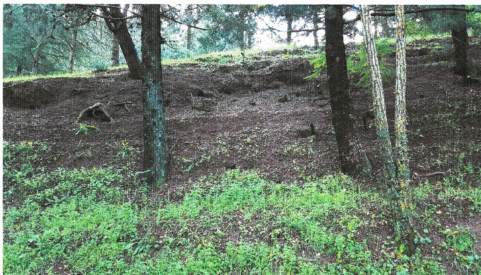
Figura 6 - Fenomeni di movimento franoso a cui porre rimedio con tecniche di Ingegneria Naturalistica