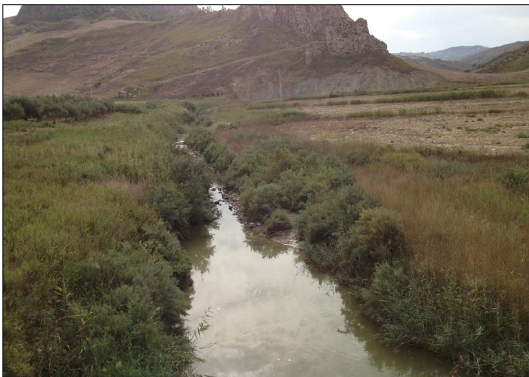
Foto n° 6 – Alveo del Fiume Salito, in corrispondenza del Ponte sulla S.P. n° 23 – Tratto di valle.

L'ufficio di Protezione Civile durante il sopralluogo ha riferito che in occasione di eventi meteorici particolarmente intensi, come quello verificatosi nel 2009, le acque di scorrimento superficiali hanno invaso le aree golenali limitrofe alla S.P. n° 23 rischiando di coinvolgere la sede stradale stessa e le aziende agricole poste ai margini del cavo fluviale.