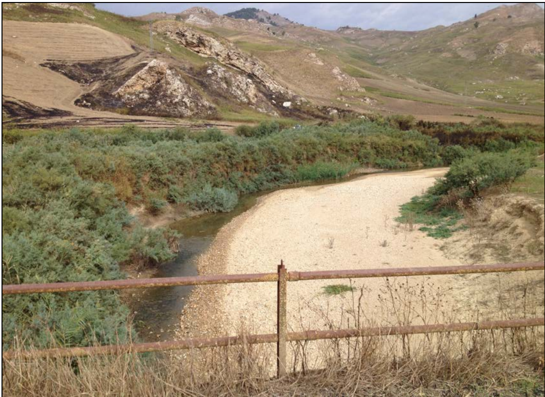
Foto n° 5 – Alveo del Fiume Salito, in corrispondenza del Ponte sulla S.P. n° 23 – Tratto di monte