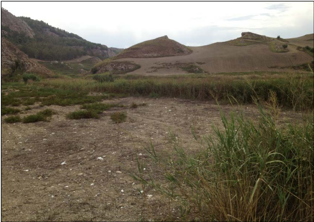
Foto n° 4 – Fiume Gallo D'Oro, in corrispondenza della confluenza con il F. Salito.