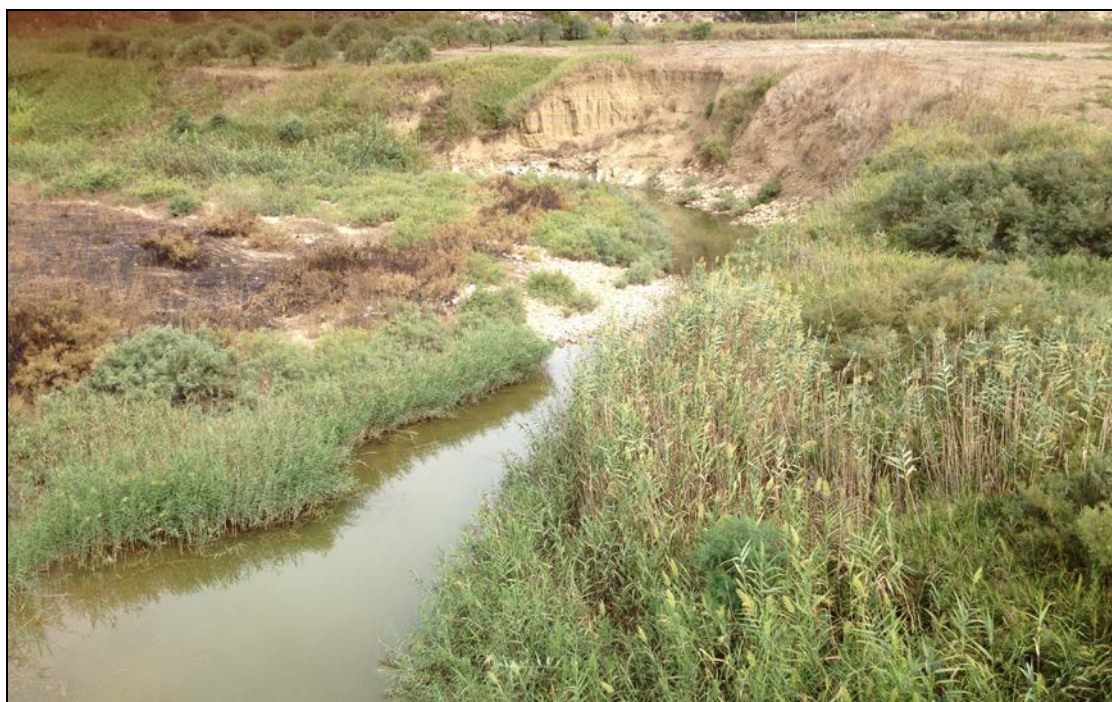
Foto n° 3 – Condizioni dell'alveo a valle del Ponte della S.P. n° 23 sul Fiume Gallo D'Oro.