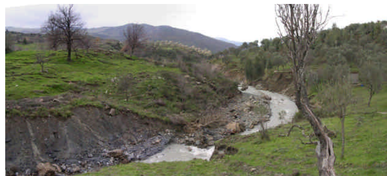
FOTO 14 (Frana di Piano Arzano): effetti secondari dell'ostruzione del Torrente Scavioli