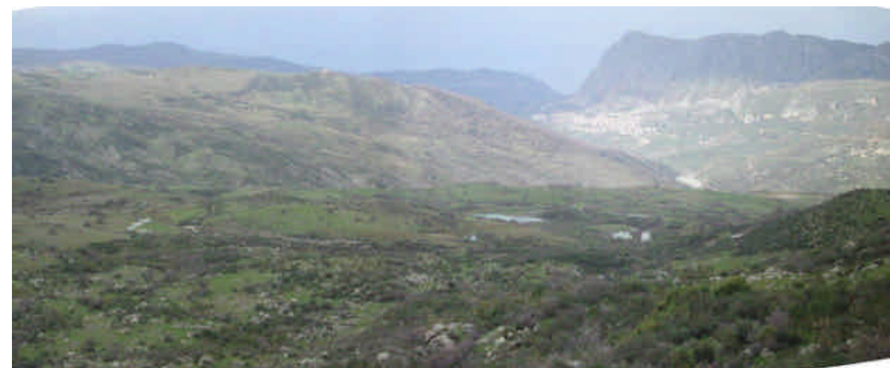
FOTO 9 (Frana di Piano Arzano): veduta parziale del corpo di frana