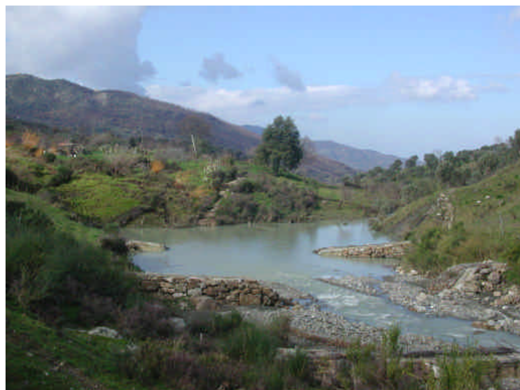
FOTO 6 (Frana di Piano Arzano): l'unghia di frana nel Torrente Scavioli