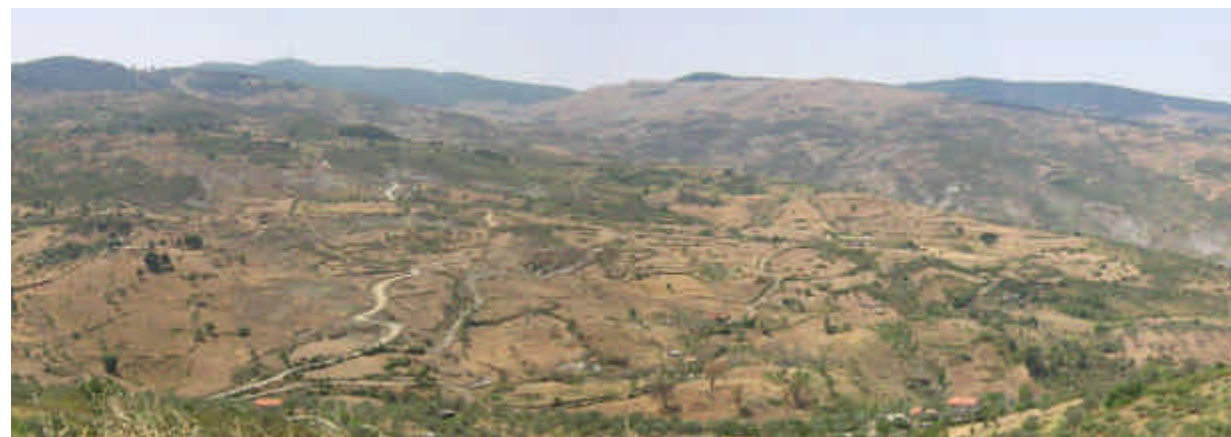
FOTO 1 (Frana di Piano Arzano): panoramica della porzione inferiore