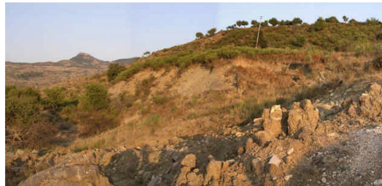
FOTO 3 (Frana di Piano Arzano): panoramica della nicchia di distacco a valle di Piano Arzano