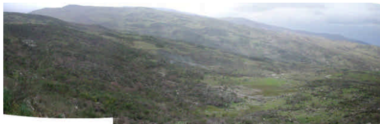
FOTO 2 (Frana di Piano Arzano): sullo sfondo, la nicchia di distacco principale; in primo piano, la paleo-nicchia di Piano di Stèseni