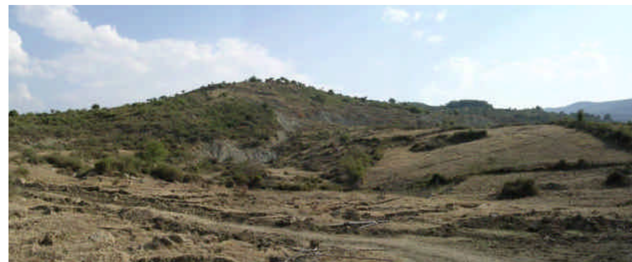
FOTO 4 (Frana di Piano Arzano): scoscendimento roto-traslattivo a valle di Piano Arzano