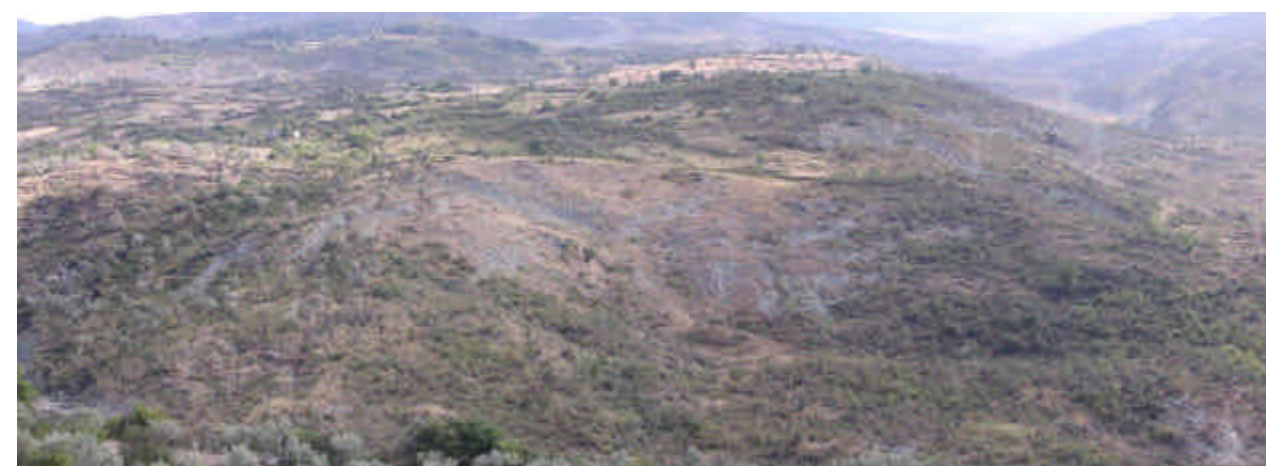
FOTO 8 (Frana di Piano Arzano): scoscendimenti in prossimità del Torrente Scavioli