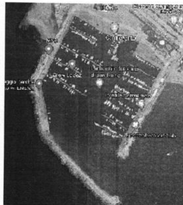
VEDUTA DAL FARO