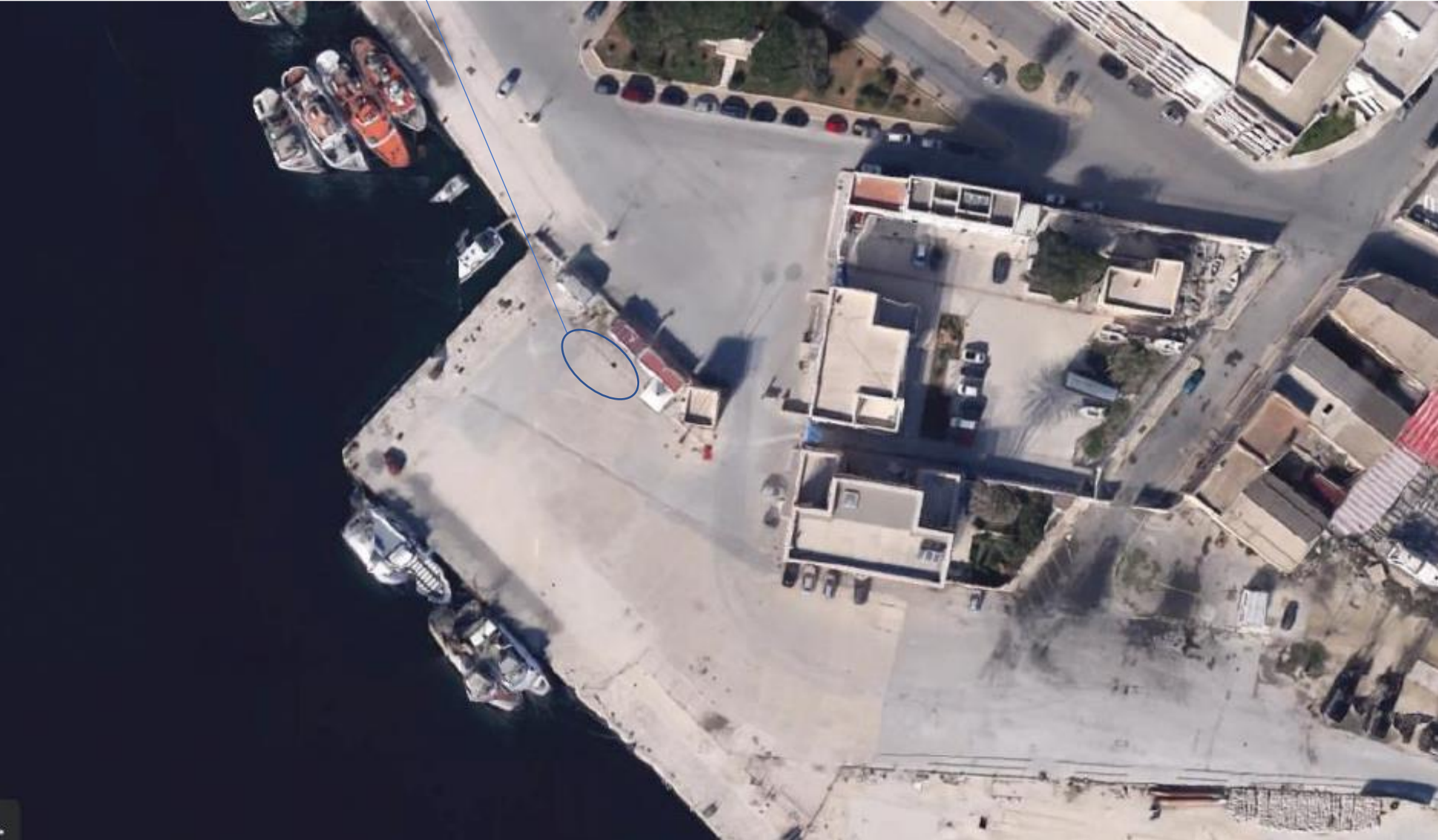
Collocazione del Welcome Terminal "Marsala"