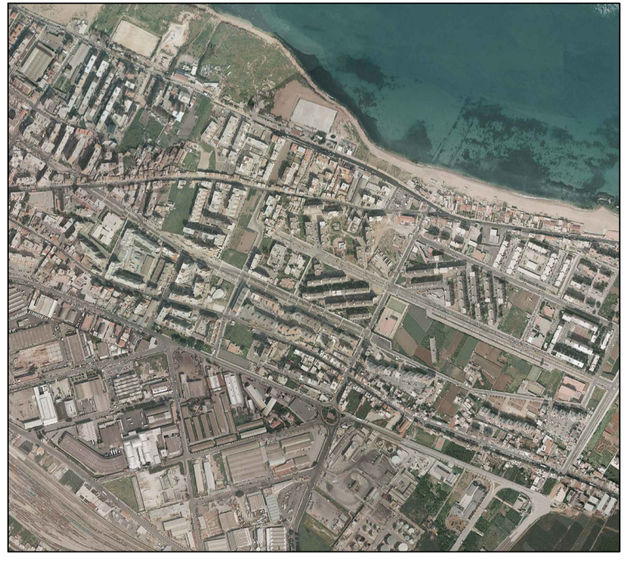
Tav. B - Interventi in Ambito Sperone

ACCORDO DI PROGRAMMA REGIONE SICILIANA - COMUNE DI PALERMO PER LA REALIZZAZIONE DEGLI INTERVENTI PREVISTI NEL P.I.I. AMBITO SAN FILIPPO NERI E NEI P.R.U. AMBITI BORGO NUOVO E SPERONE AMBITO SPERONE