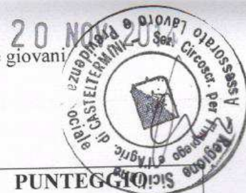
TABELLA A: LAUREA SPECIFICA