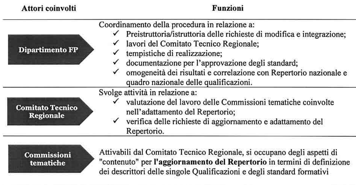
Figura 1 – Attori coinvolti nella procedura e funzioni specifiche

La procedura di aggiornamento del Repertorio delle qualificazioni, attivata dagli attori del territorio o dalla stessa Amministrazione regionale, è coordinata e gestita dal Dipartimento dell'istruzione e della formazione professionale della Regione Siciliana (di seguito Dipartimento della FP). E' previsto, altresì, il coinvolgimento di diversi soggetti che operano in cooperazione con l'Amministrazione, ovvero il Comitato Tecnico Regionale e le commissioni tematiche.