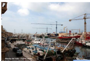
Mazara del Vallo - il porto centrale